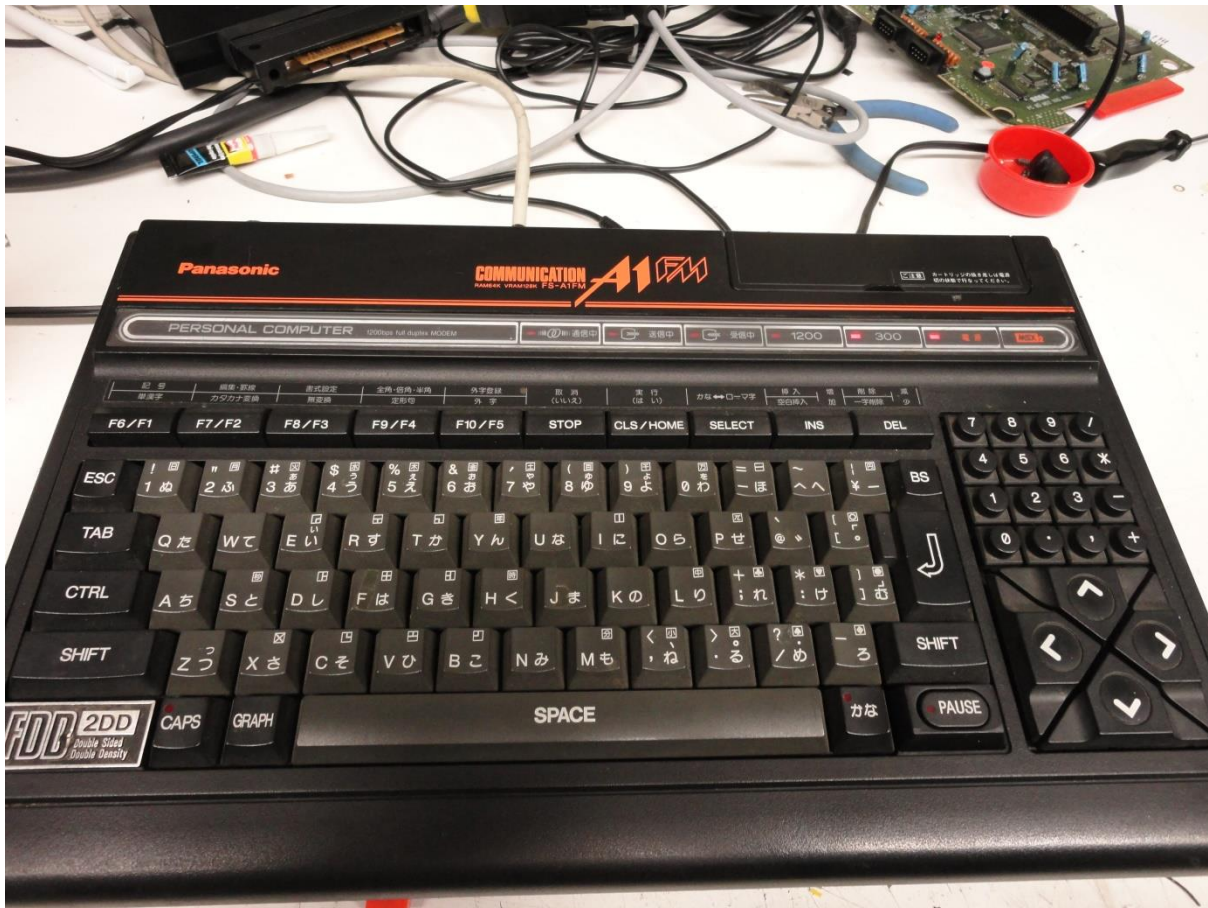
De Panasonic FS-A1FM.

Het belangrijkste onderdeel in de computer is de printplaat. Onderdelen kunnen vervangen worden, echter de printplaat niet. Probeer de onderdelen niet uit te solderen, maar knip ze los en verwijder daarna de soldeerpinen. Het gebruik van IC-voeten is aan te raden.